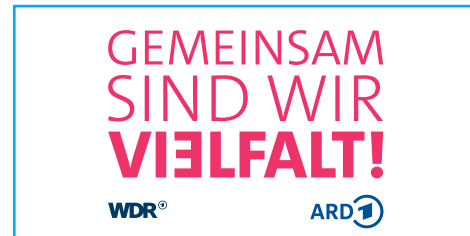
Programmschwerpunkt Vielfalt beim WDR