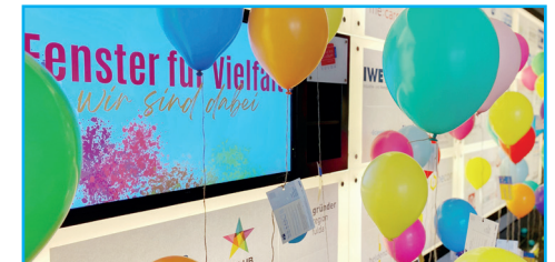
Fenster für Vielfalt bei der IHK Fulda