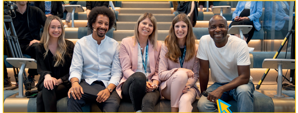
Diversity Week bei der BMW AG