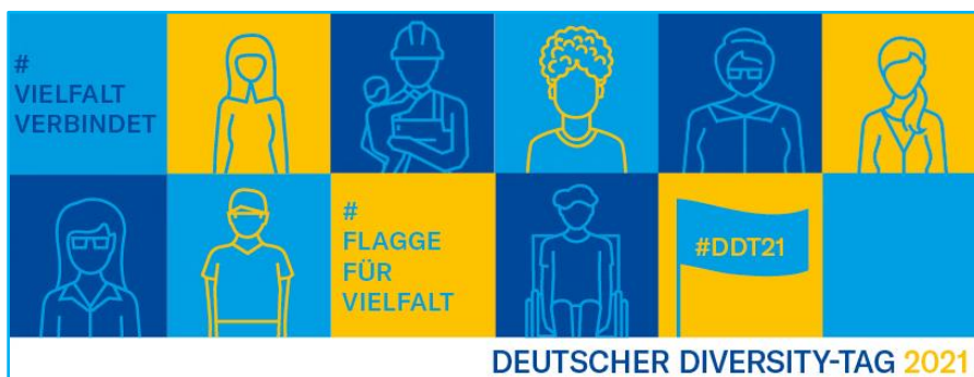
Social Media- Banner Facebook

Zeigen Sie maximales Engagement, indem Sie auf Ihrer Profilsseite das Logo und Motto des 9. Deutschen Diversity-Tags posten.