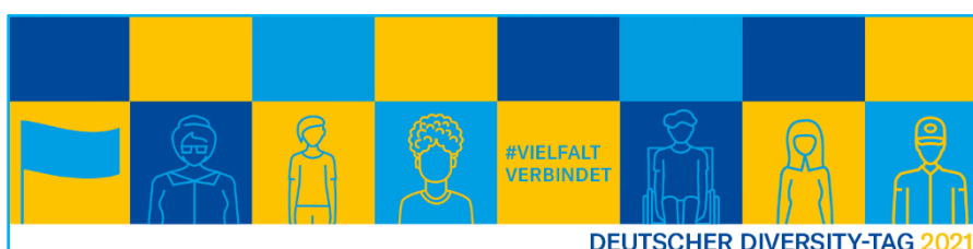
Social Media- Banner LinkedIn