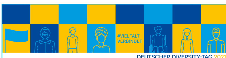
Social Media- Banner LinkedIn