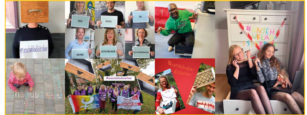
„Kein Mensch passt in eine Schublade“ – #unschubladiesbar: Die Social Media-Aktion des IQ Netzwerks Hamburg.

Auf unserer Webseite finden Sie vielfältige Aktionsideen: www.deutscher-diversity-tag.de/aktionsideen