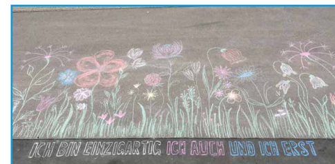
Hier ist Vielfalt zuhause - Street-Art-Aktion der HAKRO GmbH.

6 Lassen Sie Ihrer Kreativität freien Lauf – Jede Aktion spricht für sich und gemeinsam bilden wir ein großes Ganzes