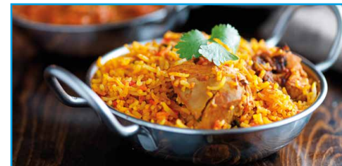
Vielfalt geht durch den Magen - mit dem (virtuellen) Kochbuch der PFLEGEFUXX - Merkur Service und Dienstleistungs GMBH.