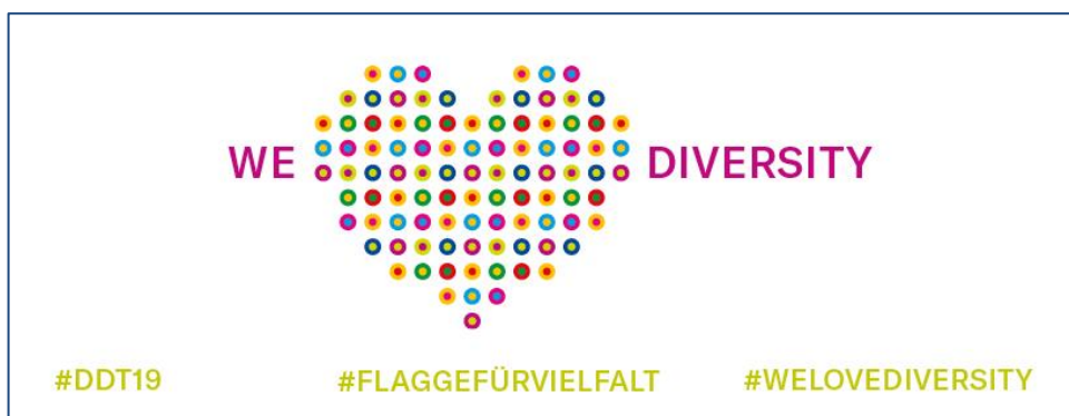
Facebook Cover Foto

Zeigen Sie maximales Engagement, indem Sie auf Ihrer Profilseite das Logo und Motto des 7. Deutschen Diversity-Tags 2019 posten.