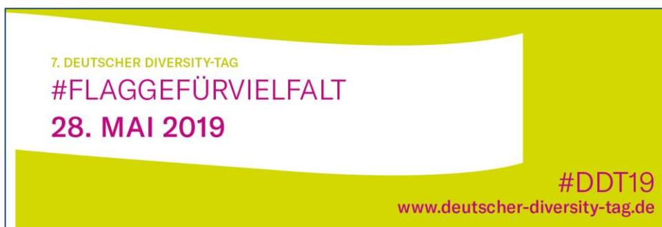
Twitter Header Foto