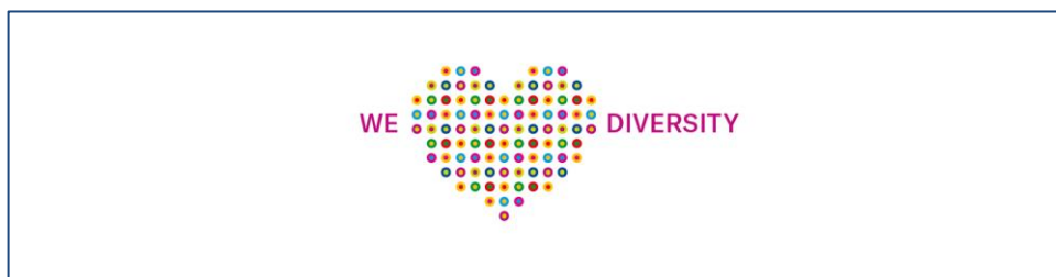
LinkedIn Background Foto