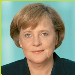
Bundeskanzlerin Dr. Angela Merkel, Schirmherrin der Charta der Vielfalt:

Innerhalb kürzester Zeit ist die Charta der Vielfalt zu einem der größten Diversity-Unternehmensnetzwerke Deutschlands und zu einem wichtigen Bestandteil der deutschen Arbeitswelt geworden. Über 1.750 Unternehmen und Institutionen mit mehr als 6,7 Mio. Beschäftigten haben die Charta der Vielfalt als Selbstverpflichtung inzwischen unterschrieben und sich damit zu deren Grundsätzen bekannt.